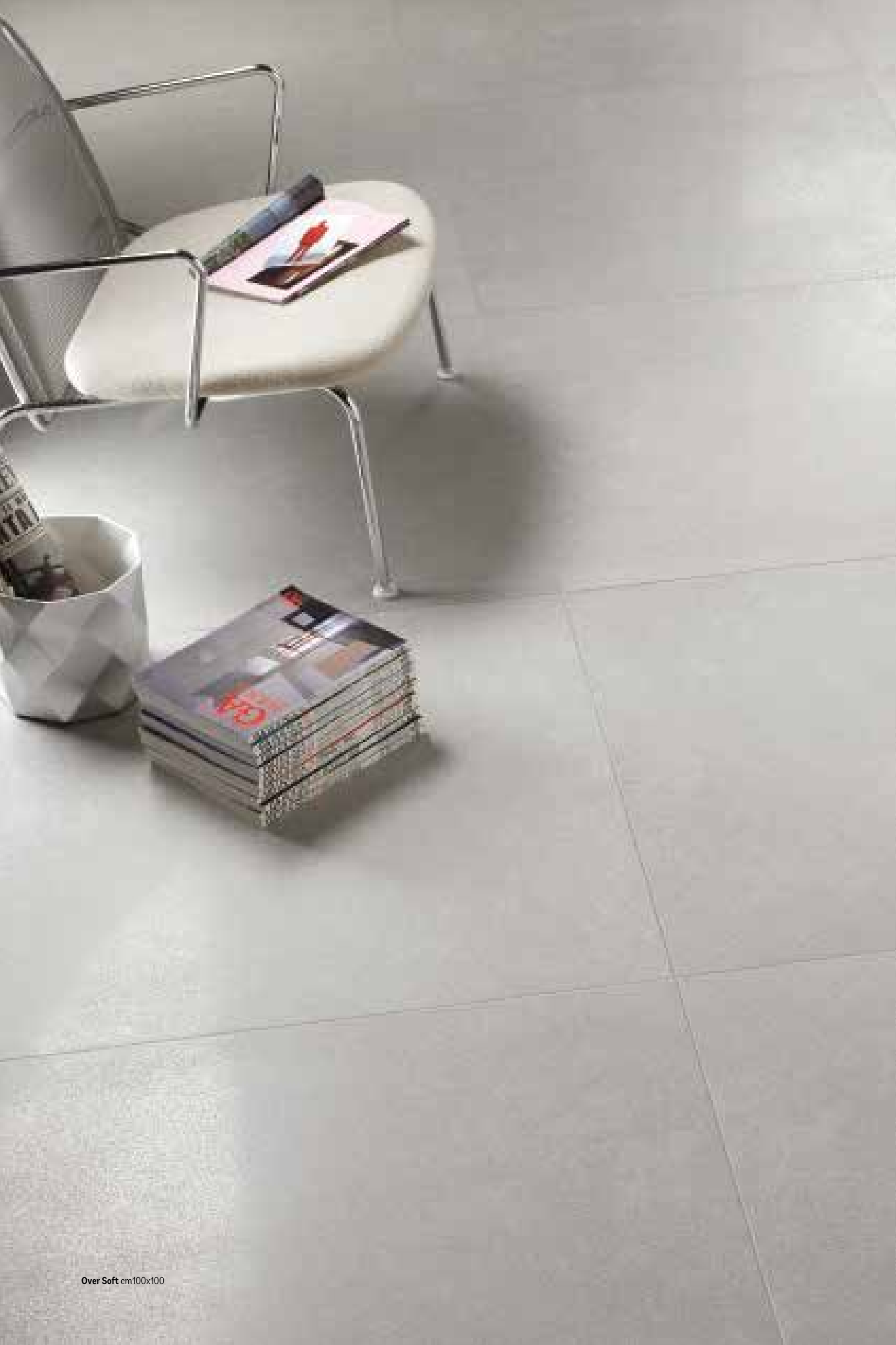
Over Soft cm100x100